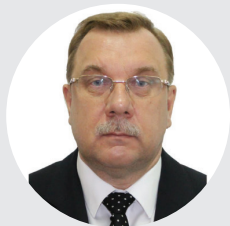
Дудник Вячеслав Юрьевич

Республика Казахстан, Вице-министр здравоохранения республики.