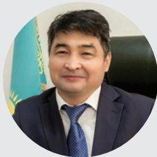
Калиев Асет Аскерович

Республика Казахстан, Вице-министр здравоохранения республики.